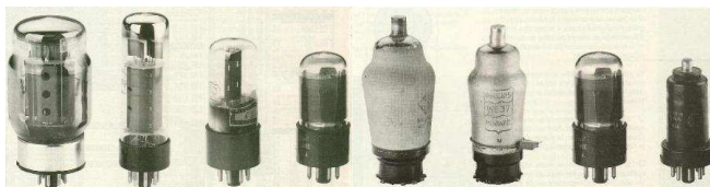
Des tubes électroniques

fonctionnent avec des tubes électroniques (ou lampes, les mêmes que l'on trouve dans les anciens postes de radio). La miniaturisation des systèmes n'est donc pas aussi poussée que dans notre monde, même si les découvertes technologiques de Fallout sont plus avancées. Ainsi, l'électronique a permis des prouesses scientifiques, mais les ordinateurs fonctionnent avec des systèmes d'exploitation ressemblant à notre système MS DOS. Les super calculateurs ressemblent à de grosses armoires design remplies de lampes, les postes radio ressemblent à nos anciens postes à galènes.