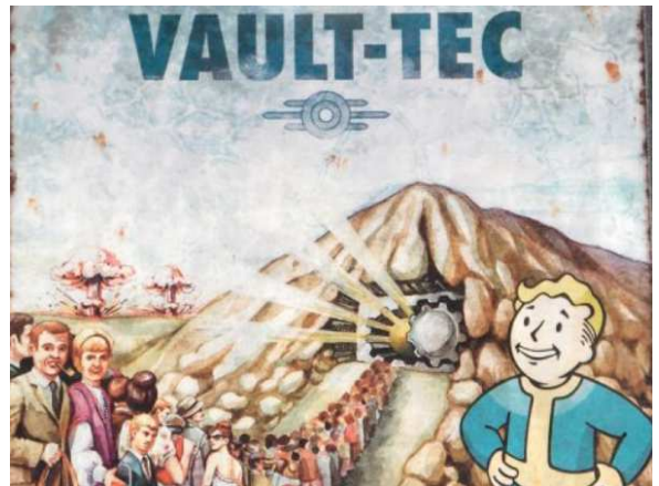
Publicité pour Vault-Tec et ses Abris

En 2077, la troisième guerre mondiale, appelée aussi Grande Guerre, a ravagé la surface de la planète. Cette guerre est l'aboutissement d'une période de plusieurs décennies de lutte entre les états pour le contrôle des ressources pétrolières de la planète, période nommée Guerre des Ressources. Les tensions et les conflits générés amenèrent à la dissolution de l'Organisation des Nations Unies en 2052. En 2053, la Nouvelle Peste éclate aux Etats-Unis, forçant le pays à une quarantaine nationale. L'attentat terroriste nucléaire de Tel Aviv en 2053 et l'échange de bombes atomiques lors du conflit Euro-Moyen-Oriental de 2054 pousse le gouvernement américain à développer le projet "Safehouse" : des abris antiatomiques autonomes, capables de servir d'habitation à des centaines de personnes, sont construits par la société Vault-Tec. En 2066, la Chine, en proie à une crise énergétique sans précédent, envahit l'Alaska pour en piller les ressources.